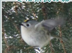
～冬に県民の森で見られる鳥たち～

冬に行く野鳥観察は、木の葉っぱが落ちているので木の上で生活している鳥たちが見えやすく、オススメです。