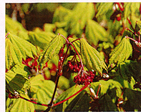
ハウチワカエデ (ムクロジ科)