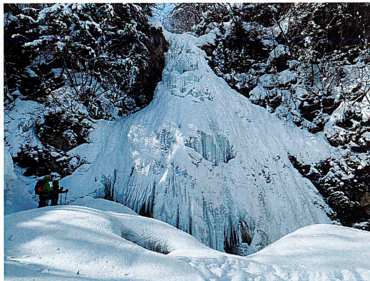
氷瀑の七滝 2021年1月31日