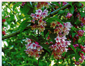
タニウツギ (スイカズラ科)