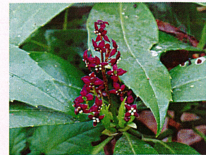
ヒメアオキ (ガリア科)