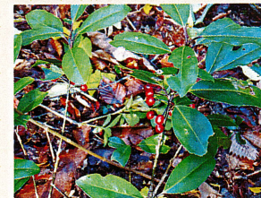
ヒメモチの実 (モチノキ科)