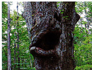
マンダの木 (アオイ科)

このあたりに多い木で、正式名はシナノキ。写真の木は、樹洞が口のように見えて「顔の木」と呼ばれ登山者に愛されています。