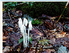
アキノギンリョウソウ (ツツジ科)