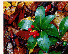
ツルシキミの実 (ミカン科)