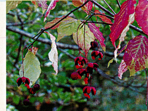
ツリバナの実 (ニシキギ科)