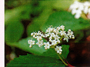
ミヤマガズミ (ガズミ科)