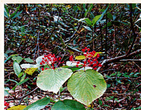
オオカメノキの実 (ガズミ科)