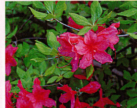
ヤマツツジ (ツツジ科)