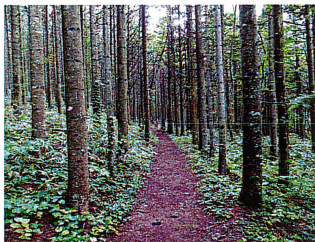
トドマツ林 (マツ科)

このあたりに多い木で、正式名はシナノキ。写真の木は、樹洞が口のように見えて「顔の木」と呼ばれ登山者に愛されています。