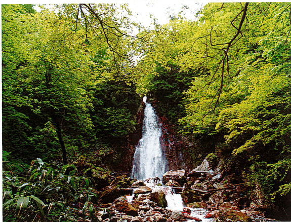
新緑の七滝 2021年6月1日