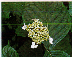
エゾアジサイ (アジサイ科)