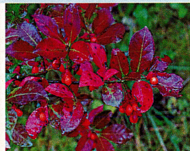
コマユミの実 (ニシキギ科)