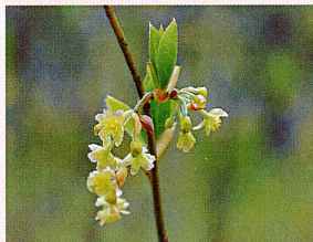
オオバクロモジ (クスノキ科)