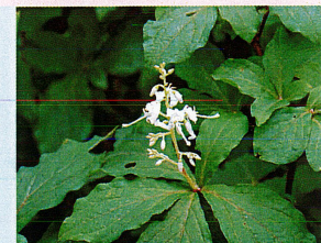
ホツツジ (ツツジ科)