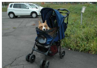
先月、県民の森に遊びに来たわんこ。かわいかったので思わずパチリ!