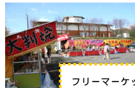
フリーマーケットも同時開催！