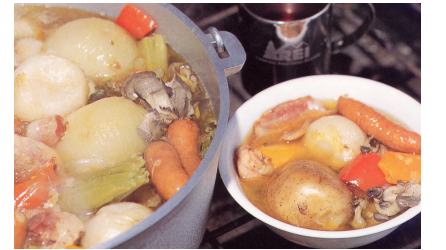
「ダッチオープン&燻製入門」山と溪谷社 鈴木アキラ著 より

ジャガイモもタマネギも丸ごと入れるのには訳があります。長時間煮込んでも煮崩れしないのです。ダッチオープンなら丸ごとでも普通の鍋の約半分の時間で火が通りますよ！