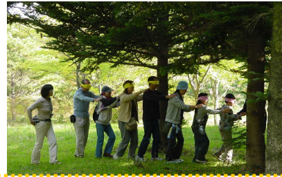
大人も子どももネイチャーゲーム！初めての体験にみんなドキドキ

10月16日(日)、「県民の森秋祭り」が開催されました。紅葉にはほんの少し早かったものの、当日はさわやかな秋晴れとなり、子どもからお年寄りまでたくさんの方においで頂きました。おかげさまで学習館の入館者数も来館以来の2000人を記録いたしました！！「秋の空気・紅葉を感じる」「自然ともっと友達になる」、そんなテーマのもとに、ネイチャーゲーム、木工体験、野だて、魚のつかみ取りの4つのプログラムを柱にした大イベントでした。今後、今回の結果をもとに、より楽しい「県民の森秋祭り」、また、学習館のイベントを作り上げていきたいと思っております。みなさんのお越しをお待ちしております！！