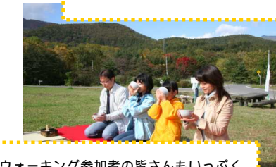
紅葉ウォーキング参加者の皆さんもいっぴく