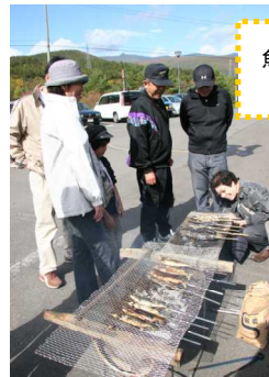
魚のつかみ取りは子どもたちに大人気！