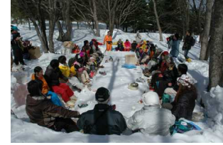
雪のテーブルでティータイム