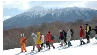
岩手山もきれいでした

3月21日にフォレストI主催のイベントがありました。老若男女総勢38名が参加し、雪の県民の森へかんじきトレッキングに出かけました。途中、雪のテーブルでティータイムをしたり、ゲームをしたり、樹木の説明を受けたり、好天も手伝ってとても楽しい1日となりました。