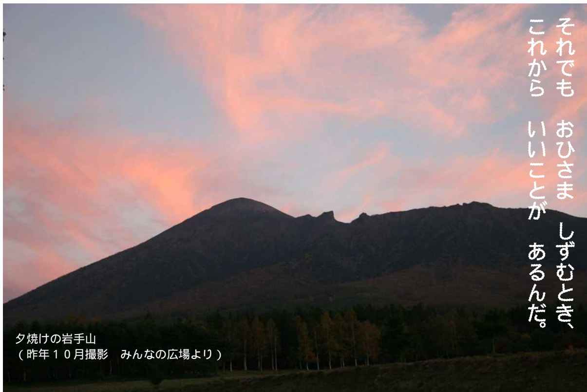
夕焼けの岩手山 (昨年10月撮影 みんなの広場より)

2006年10月号 発行:岩手県民の森 森林ふれあい学習館 (いわてNPOセンター・小岩井農牧共同体)