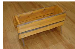
間伐材プランター