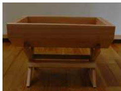
たる型プランター