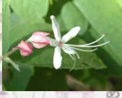
クサギ(写真は8月下旬)