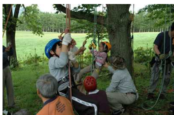
ツリークライミング体験 撮影：7月16日