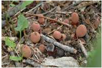
ミヤマツチトリモチ

コメント：森のガイドってどんなことしてるの？ 対象に よってプログラムを変えています。今回は、実際にこの 夏行った子ども会向けのプログラムを紹介します。