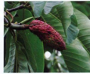
ホオノキ (モクレン科)