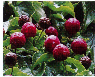
ヤマボウシ (ミズキ科)