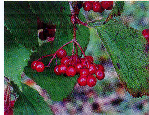
ミヤマガズミ (ガズミ科)