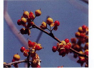
ツルウメモドキ (ニシキギ科)