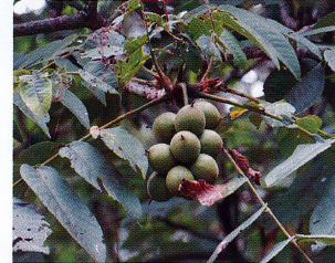
オニグルミ (クルミ科)