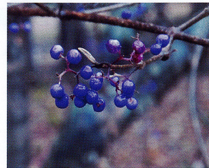
ムラサキシキブ (シソ科)