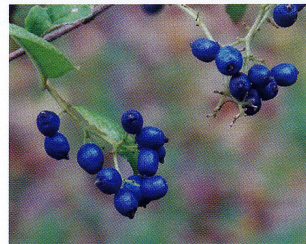
サワフタギ (ハイノキ科)