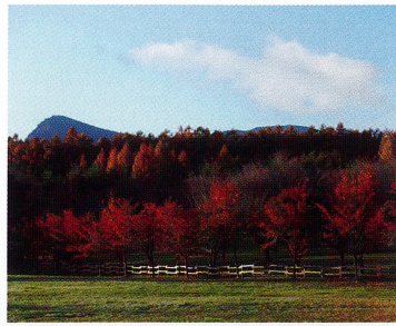
【黒倉山とカラマツ・サクラの紅葉】

空が澄んで高くなり、八幡平の山並みを背景に美しい紅葉が楽しめます。早くは8月下旬のオオヤマザクラの赤い色付きから、11月初旬のカラマツの黄金色の黄葉まで。次々と鮮やかな彩りを見せてくれます。