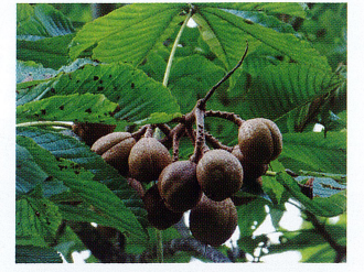
トチノキ (ムクロジ科)