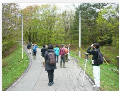
観察時のイメージ